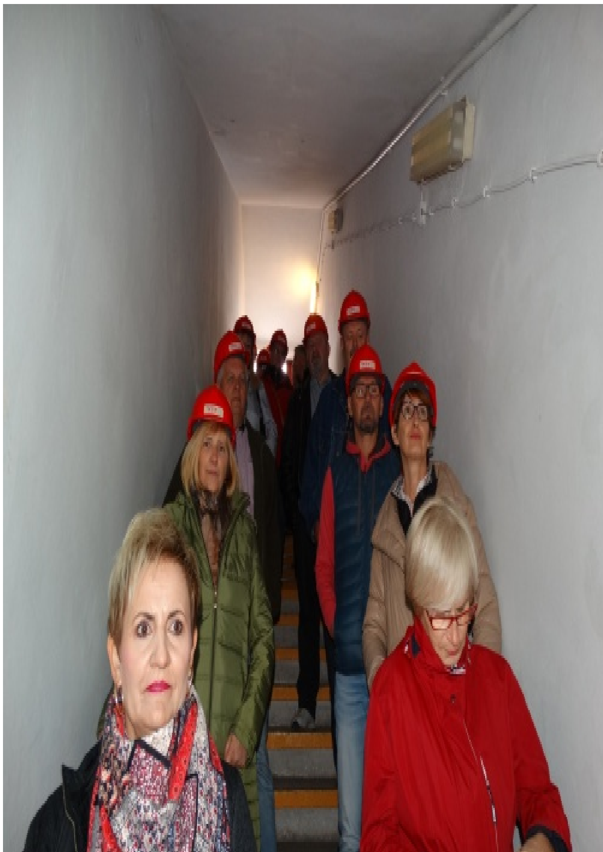
Rys. 4. NIGDY NIE GAŚ tłuszczu i oleju WODĄ!