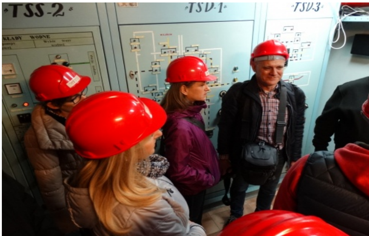
Rys. 5. Liczba zdarzeń związanych z tlenkiem węgla, liczba uszkodzonych i ofiar śmiertelnych w sezonach grzewczych 2010/2011, 2011/2012, 2012/2013, 2013/2014, 2014/2015, 2015/2016, 2016/2017, 2017/2018.