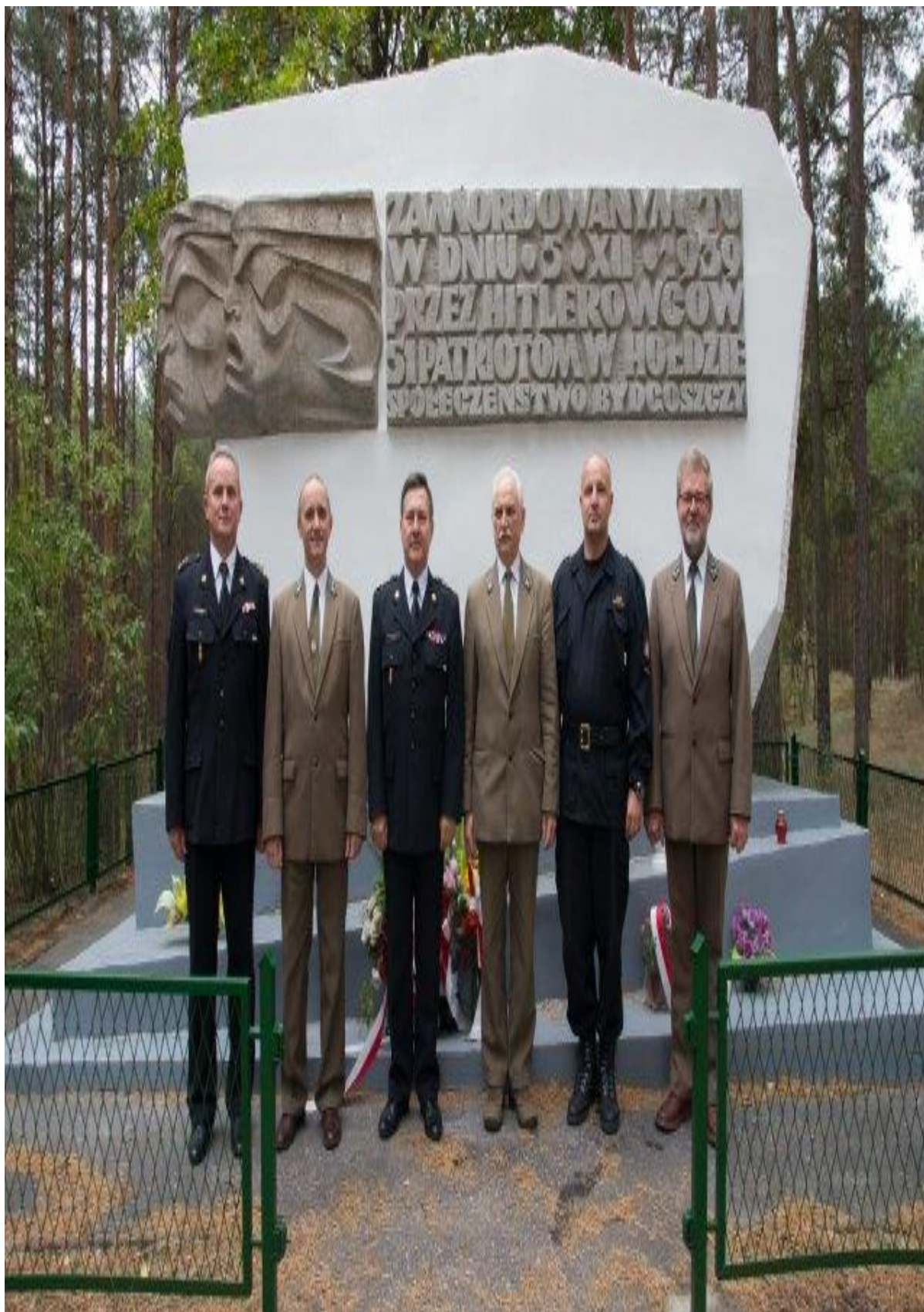
Rys. 3. W Polsce corocznie powstaje ponad 150 000 pożarów, co piąty z nich powstaje w domach.