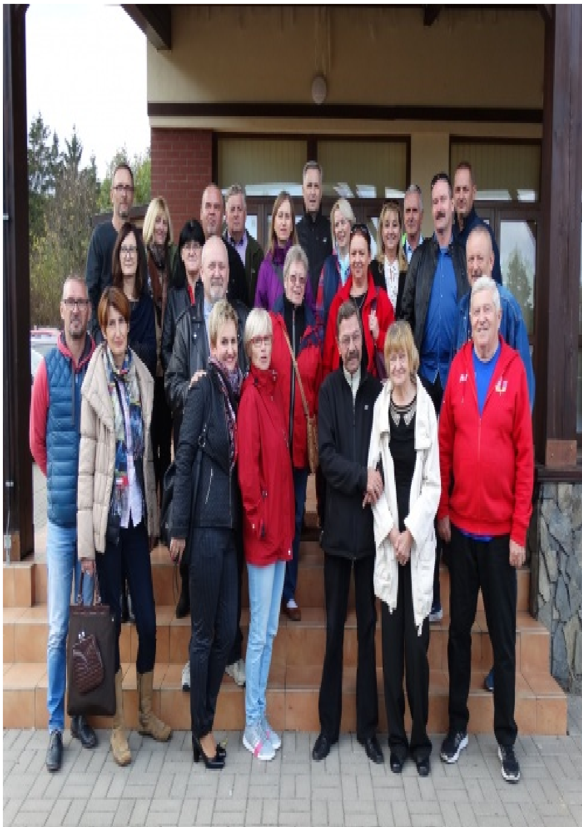
Rys. 2. Te objawy mogą świadczyć o obecności tlenku węgla.